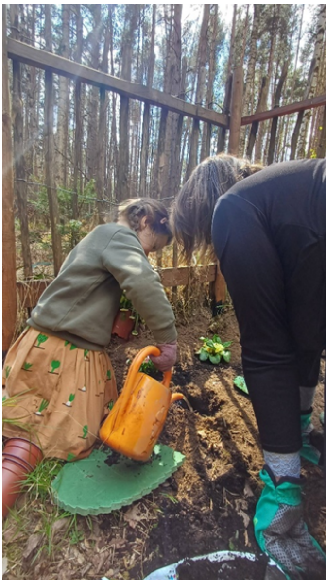
Sázení květin, které děti s průvodkyněmi kúpaly na ozdobení stolu při Jarní slavnosti.